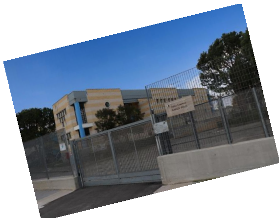
Plesso "Marco Polo"