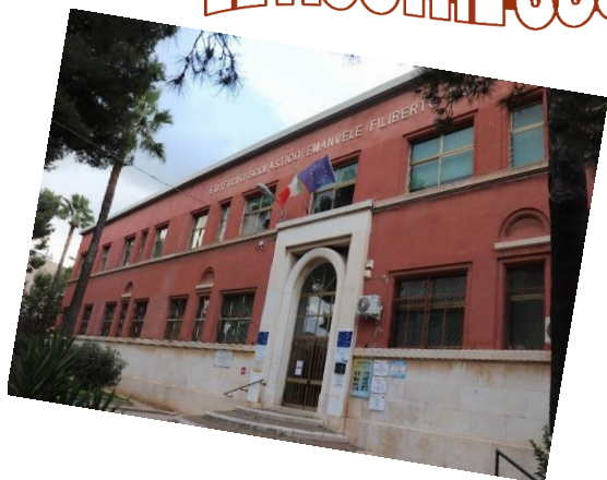
Plesso "Duca d'Aosta"